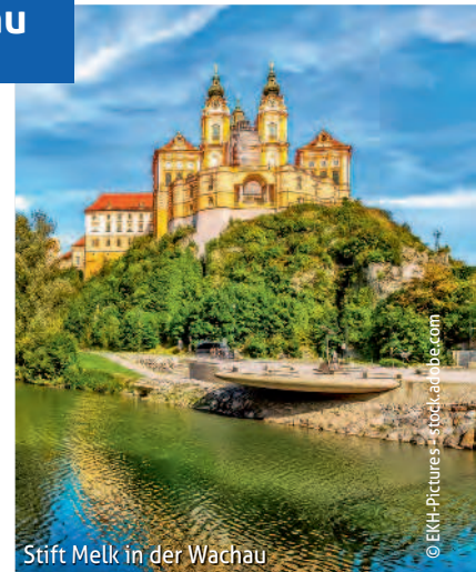
Stift Melk in der Wachau