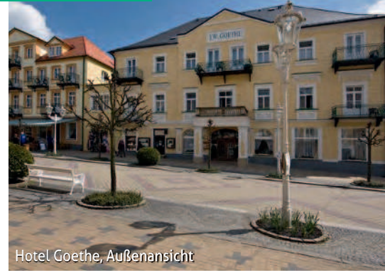
Hotel Goethe, Außenansicht