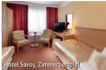
Hotel Savoy, Zimmerbeispiel