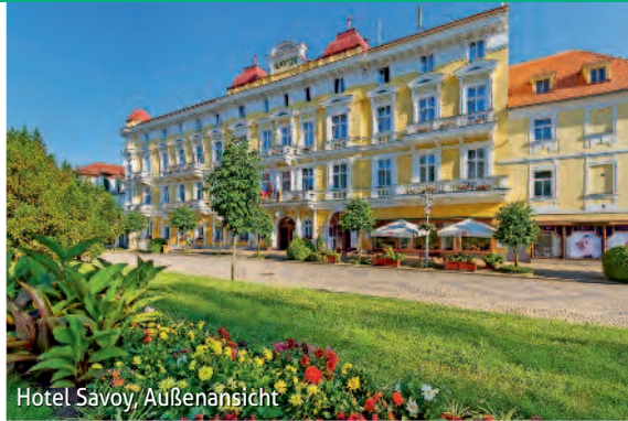
Hotel Savoy, Außenansicht