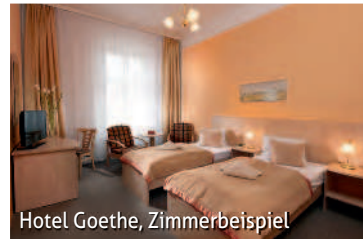
Hotel Goethe, Zimmerbeispiel