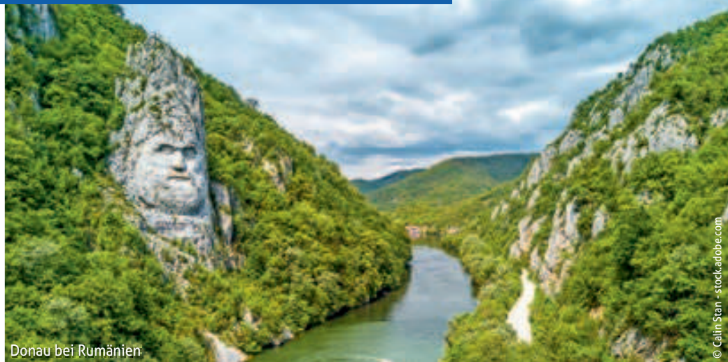
Donau bei Rumänien

Lehnen Sie sich ganz entspannt zurück und genießen den Ausblick auf die vorüberziehenden Landschaften.