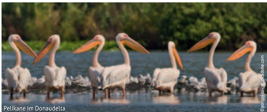
Pelikane im Donaudelta