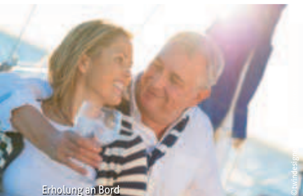
Erholung an Bord