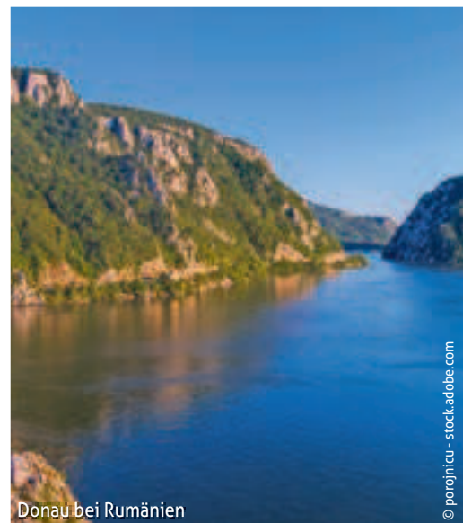
Donau bei Rumänien