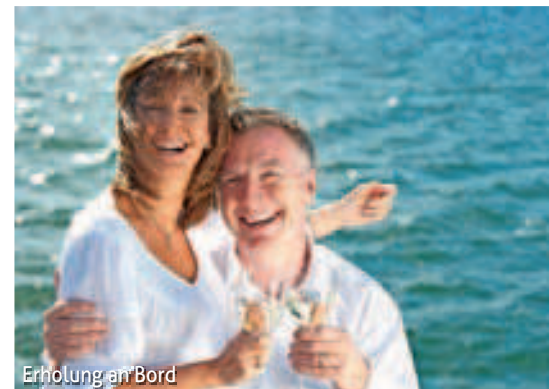
Erholung an Bord

ten, wie den Platz der Republik und die Festung Kalemegdan. Alternativ haben Sie die Möglichkeit die Stadt aktiv bei einer E-Bike Tour zu erkunden oder eine Panoramafahrt nach Topola (beides an Bord buchbar) mit dem Besuch der St. Georgs-Kirche zu unternehmen. Später am Tag empfehlen wir Ihnen den Abendausflug mit einer temperamentvollen Folkloredarbietung (an Bord buchbar).