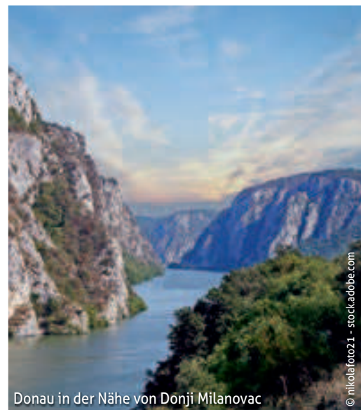
Donau in der Nähe von Donji Milanovac