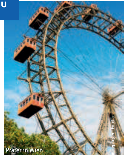
Prater in Wien