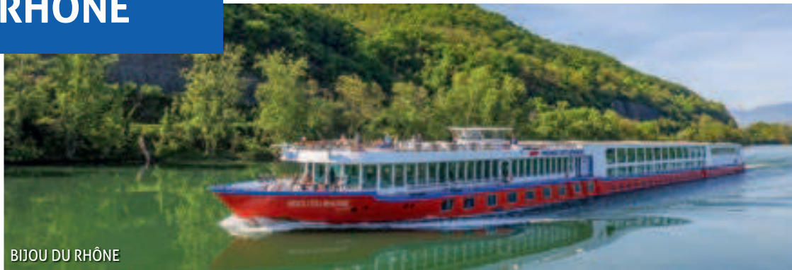
BIJOU DU RHÔNE