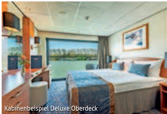
Kabinenbeispiel Deluxe Oberdeck