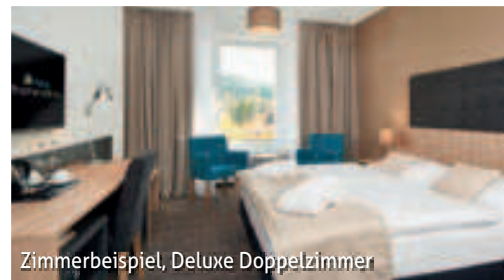
Zimmerbeispiel, Deluxe Doppelzimmer