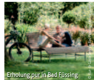
Erholung pur in Bad Füssing