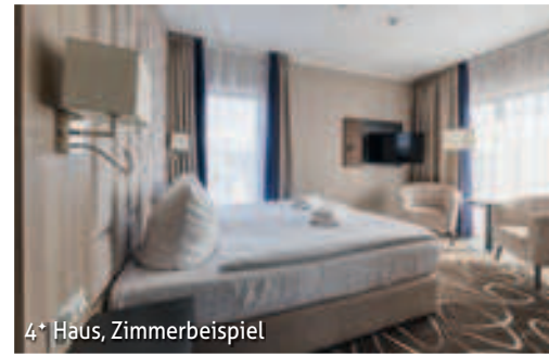
4* Haus, Zimmerbeispiel