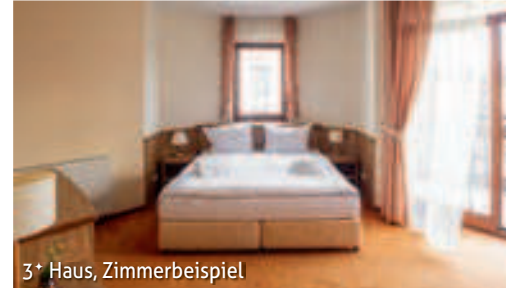
3* Haus, Zimmerbeispiel