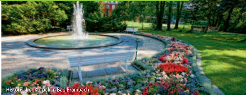
Historischer Kurpark in Bad Brambach

Preise für einen Aufenthalt ohne Kurpaket (ambulante Badekur) im Santé Royale Resort Bad Brambach erhalten Sie gerne auf Anfrage.