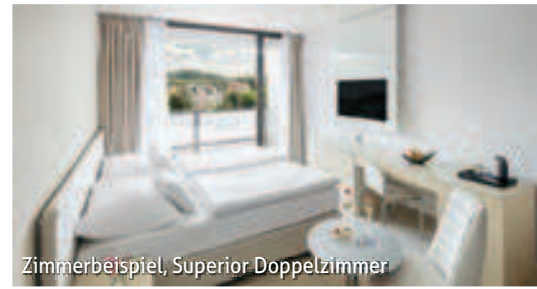
Zimmerbeispiel, Superior Doppelzimmer